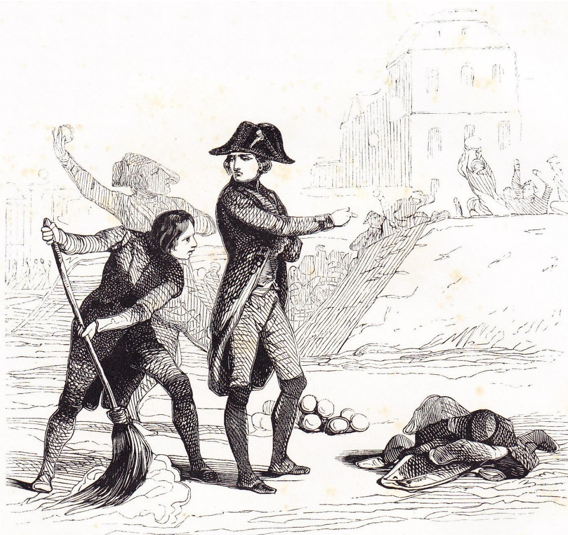
Napoléon à l'école de Brienne.